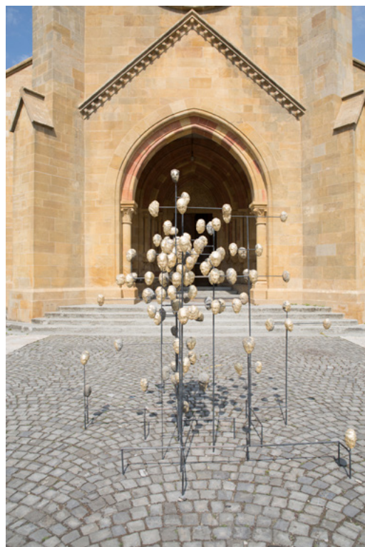
« Ruptures » (2017) de Ledelle Moe devant la Collégiale de Neuchâtel

Au cours de son séjour à Neuchâtel, Mme Moe a utilisé cette méthode pour produire une série de petites têtes pour une performance artistique commandée par la ville de Neuchâtel dans le cadre des 500 ans de